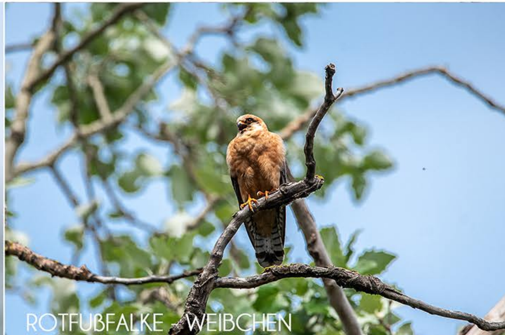
ROTFUßFALKE - WEIBCHEN