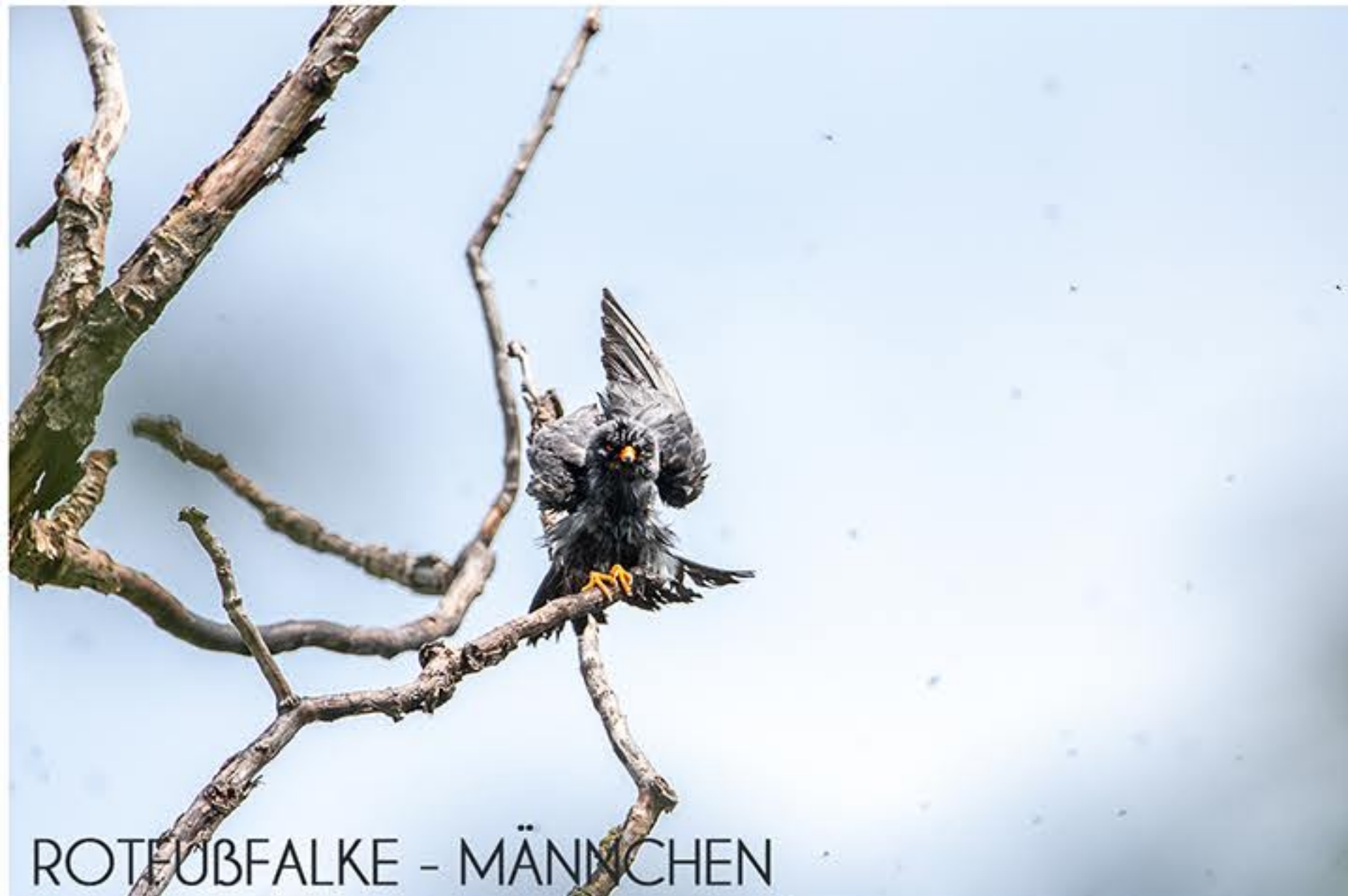
ROTFUßFALKE - MÄNNCHEN